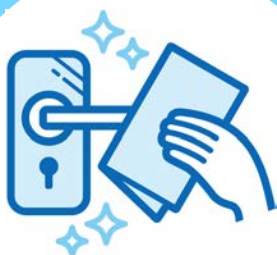
接触部の消毒の強化*