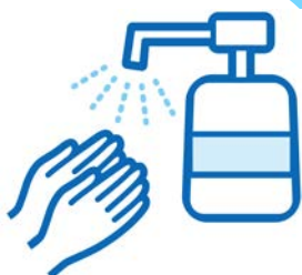
アルコール消毒の徹底